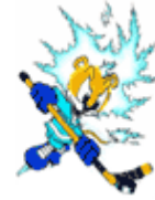
Helsingin 2003 Jääkiekon MM-kisojen maskotti

Kanada voitti jääkiekon maailmanmestaruuden Helsingissä. Kanada nujersi MM-loppuottelussa Ruotsin jatkoerässä luvuin 3-2 (1-2,0-0,1-0,1-0).