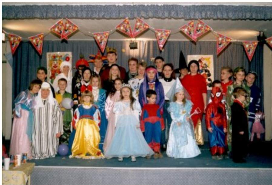
Thessalonikin Suomi-koulun karnevaaliväkeä

Hartaushetken päätyttyä syntyi vapaata keskustelua pääsiäisen traditioista yms. ja siirryimme jatkamaan keskustelua kirkkokahvin merkeissä lähellä sijaitsevaan kahvioon. Osanotto ei ollut suuri, vain 6 henkilöä. Ajan kohta (la klo 15.00) teki saapumisen mahdolliseksi monille Suomi-koulun vuoksi.