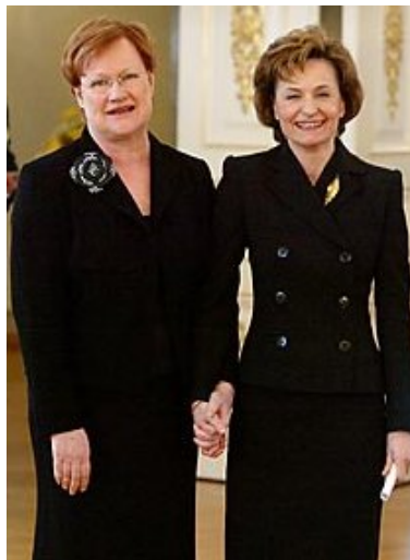
Presidentti Tarja Halonen ja pääministeri Anneli Jäätteenmäki

Tiistiaamu 15.4 ei ollut ihan tavallinen aamu Presidentinlinnassa. Ensin aukesi ovi, jonka takana presidentti Tarja Halonen odoteli; hymyillen, pirteän vihreissä. Sitten aukesi ovi ruokasalin toisessa päässä. Siellä oli eduskunnan puhemies ja hallituksen muodostaja Anneli Jäätteenmäki, arvokkaan mustissa, hymyillen.