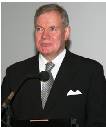
Eduskunnan puhemies Paavo Lipponen piti juhlapuheen USP:n istunnossa.

Istunnon avajaisissa juhlapuheen pitänyt eduskunnan puhemies Paavo Lipponen sanoi Suomen tarvitsevan erityisesti nuoria osaajia suurten ikäluokkien eläköityessä lähivuosina. Hänen mukaansa Suomen pitäisi valmistautua työperäiseen ja aktiiviseen maahanmuuttopolitiikkaan niin asenteissa kuin käytännön toimin. Puhemies piti tärkeänä työluopien käsittelyn nopeuttamista, byrokratian vähentämistä ja Suomessa tutkintonsa suorittaneiden ulkomaalaisten rohkaisemista jäämään Suomeen valmistumisensa jälkeen.