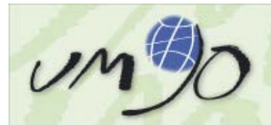
Ulkoministeriö 90 vuotta

Nyt on sitten sairasteltu kaikki Kreikassa liikkuvat virukset ja muut tarttuvat taudit! Ensimmäiset tytöt vuoronperään petin pohjalla pariin otteeseen, ja sen jälkeen minä ja vaimoni, myös pariin otteeseen. Nyt, kohta 4 viikon rumban jälkeen, alkaa pikkuhiljaa näkyä "valoa tunnelissa".