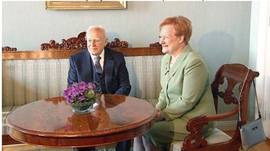
Tarja Halonen ja Kreikan presidentti Karolos Papoulias presidentinlinnassa

Lisäksi presidentti Papoulias laskee tiistaina